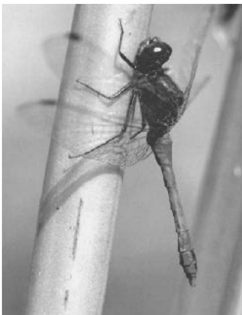
Sympetrum sanguineum (mâle)

Gilbert BESSONNAT : tél & fax 02 51 90 27 48