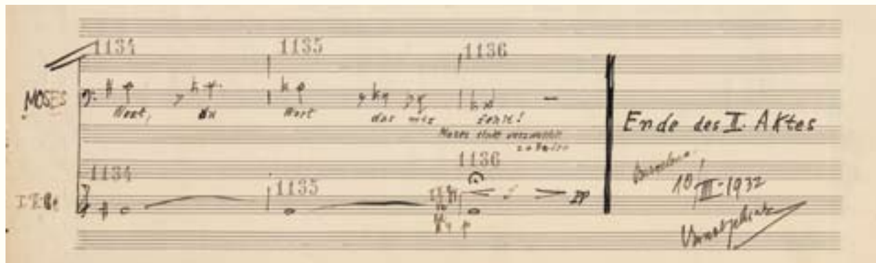
Arnold Schönberg: »Moses und Aron«, Particell