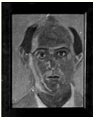
Anton Webern mit Schönbergs Selbstportrait